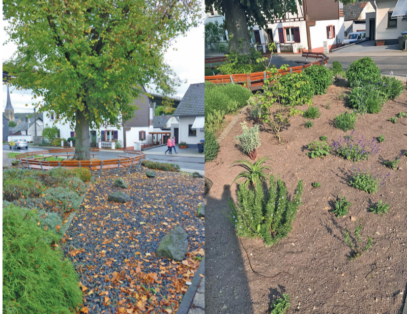
Ein Musterbeispiel aus dem Vorjahr: Die „Schöpp un Hack-Freunde in Rhens“ verwandelten die Fläche um die Kaiserlinde von einer Schotterwüste zu einem Blumenbeet, das Insekten Nahrung spendet.