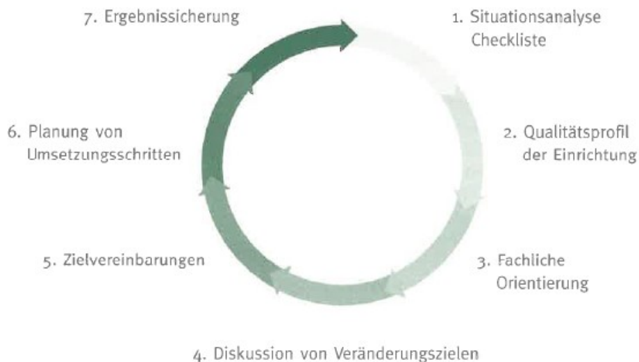
Abbildung: 7-Schritte Verfahren der Qualitätsentwicklung (Tietze, W./ Viernickel, 2016)

Die Ausgestaltung der Kita zum Familienzentrum im Sozialraum mit der verbundenen fachlichen Haltung und Orientierung, der Formulierung von Erhaltungs- und Veränderungszielen sowie überprüfbare Qualitätsstandards, die Planung der Umsetzungsschritte bis hin zur Evaluation und Ergebnissicherung wird vom gesamten Kita-Team getragen.